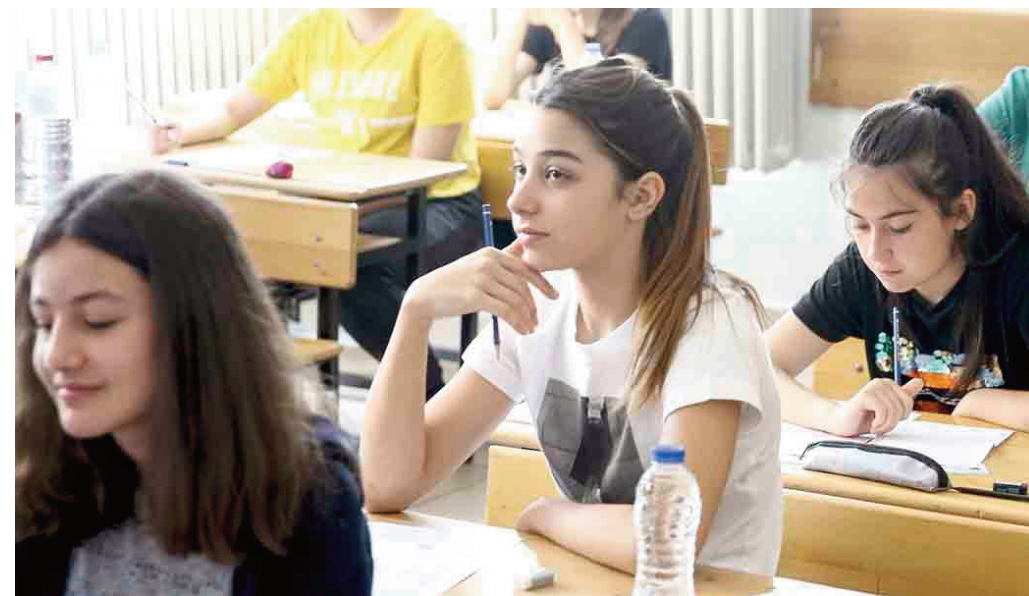
YARIN TATİL: Milli Eğitim Bakanlığı, sınav öncesinde öğrencilerin hazırlıklarını rahatça yapabilmeleri amacıyla yarın örgün eğitim kurumlarında eğitim öğretime 1 gün ara verileceğini açıkladı.

Liselere Geçiş Sistemi (LGS) kapsamında gerçekleştirilecek merkezî sınav, 13 Haziran 2026 Cumartesi günü yapılacak. İki ayrı oturum şeklinde yapılacak sınavın ilk oturumu 09.30'da ikinci oturumu ise 11.30'da başlayacak. Sınavla ilgili hazırlıklar tamamlandı.